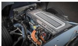
E-Type mit 190 KW E-Motor

Was in den vergangenen Jahren bereits von einigen Technikbegeisterten in meist privaten Werkstätten entstanden ist, wird inzwischen auch von professionellen Werkstätten und der Industrie mit erstem Interesse verfolgt: Die Ausstattung alter Karossen mit Elektromotoren als Ersatz für Diesel- oder Benzinmotoren. Jaguar wird beispielsweise in einer Kleinserie ab 2020 den legendären E-Type ausgestattet mit Elektroantrieb anbieten. Den sogenannten E-Zero durften Prince Harry und Meghan Markle im Mai vergangenen Jahres bereits auf Ihrer Fahrt in die Flitterwochen erfolgreich testen. Jaguar ist nicht der einzige Hersteller, der neue E-Technik in alte Karossen verbaut. Auf der Retromobil in Paris waren vom auf E-Antrieb umgebauten Mini über Citroen Mehari bis hin zum VW Käfer zahlreiche Null-Emissions-Klassiker zu sehen. Hierfür notwendiges Engineering Know-How ist auch Spezialität des Teams vom DEPOT3. In den kommenden Monaten werden wir einen zweiseitigen Kleinschnittger umrüsten auf Elektroantrieb. Dies allerdings so, dass ohne