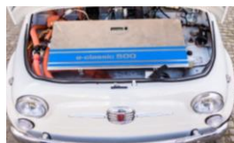
Fiat 500 E mit 17 KW E-Motor

konstruktive Änderungen die Rückrüstung auf den Originalmotor möglich ist. In unserem Newsletter werden wir über den Fortschritt des Projektes berichten.